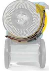
Kaareva imusuutin heilahtaa toiselle puolelle