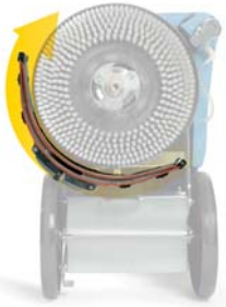
Kaareva imusuutin kulkee harjan ympärillä

Imumoottori yhdistettynä kaarevaan imusuuttimeen takaa loistavan lopputuloksen.