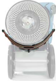
Kaareva imusuutin säilytysasennossa